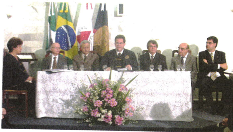
Autoridades presentes à solenidade de posse do novo presidente da ACLCL