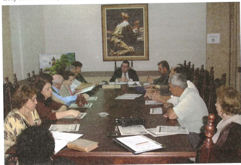
Reunião da assembleia que elegeu a nova diretoria da ACLCL