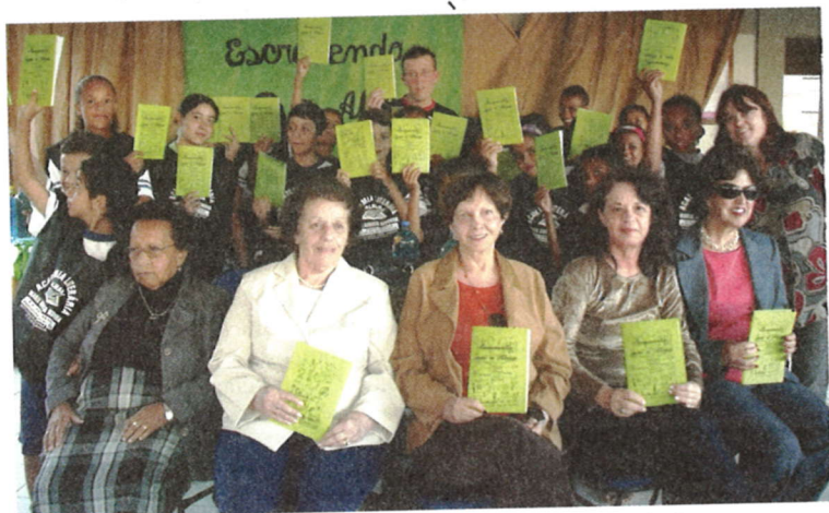
Acadêmicas presentes ao lançamento da antologia