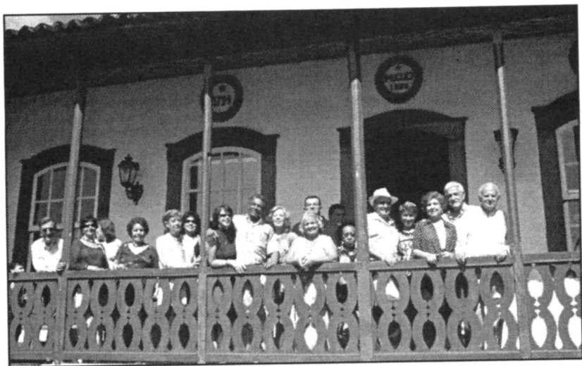
Os acadêmicos na sede da Fazenda dos Macacos, após almoço de confraternização

24 –Encerramento das comemorações do aniversário da ACLCL com um concerto do Quarteto Música Ricercata, no auditório do Colégio Nossa Senhora de Nazaré, promovido pela Secretaria Municipal de Cultura, Lazer e Turismo.