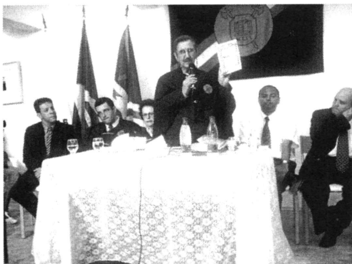
Em Lafaiete, a sessão solene foi no Espaço Lafayette