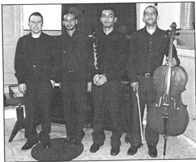
O Quarteto Música Ricercata apresentou-se no encerramento das comemorações de aniversário da ACLCL

24 –Encerramento das comemorações do aniversário da ACLCL com um concerto do Quarteto Música Ricercata, no auditório do Colégio Nossa Senhora de Nazaré, promovido pela Secretaria Municipal de Cultura, Lazer e Turismo.