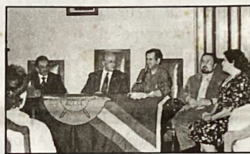
Mesa de honra em Belo Horizonte

No mesmo dia, às 16h, ocorreu a sessão solene de entrega das medalhas e diplomas aos vencedores do Concurso Literário Internacional Cidade de Conselheiro Lafaiete, que contou com a presença de autoridades, escritores premiados, além de personalidades ligadas à