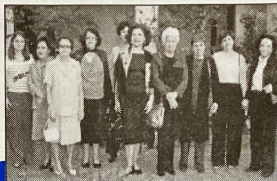
Acadêmicas premiadas, entre membros da ACLCL e convidados.

A seguir, em parceria com a União Brasileira de Trovadores - Seção de Lafaiete, participou da outorga de medalhas e diplomas aos poetas vencedores dos III Jogos Florais, com o tema PAZ. Diversos poetas procedentes de Belo Horizonte, Juiz de Fora e Rio de Janeiro vieram receber pessoalmente as