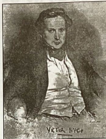
Victor Hugo. * 1802 + 1885

meira compilação de poemas, as Odes, precedidas de um importante prefácio, dando origem, em 1823, às Odes et Ballades (edição definitiva em 1828). Iniciou, igualmente, uma carreira de romancista com Han d'Islande, seguida de Bug-Jargal. Colaborou com a Inspiração Francesa, fundada em 1823, e frequentou o salão de Charles Nodier, onde encontrou Vigny e Lamartine.