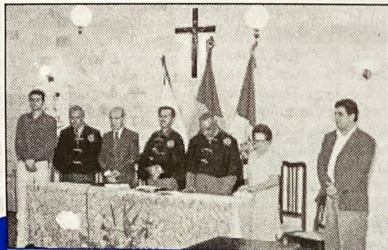
Mesa de honra das solenidades.