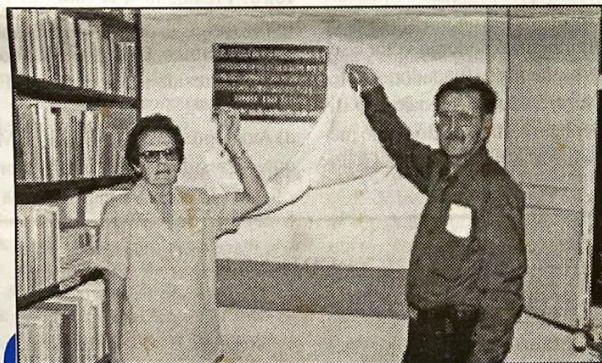
Descerramento da placa da Biblioteca "Bernardo Guimarães" pela Secretária do Conselho Superior e pelo presidente da Diretoria Executiva.

No dia de seu nono aniversário, 18 de setembro, a Academia de Ciências e Letras de Conselheiro Lafaiete - ACLCL, homenageou a cidade pelos seus 212 anos de emancipação política (19 de setembro) e o ex-presidente Juscelino Kubitschek de Oliveira, pelo centenário de seu nascimento